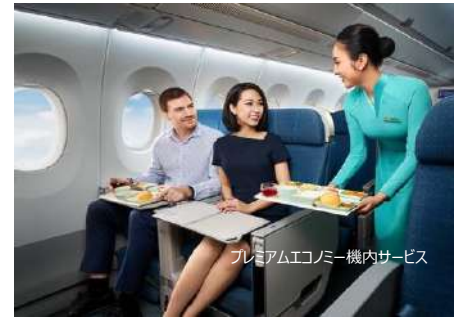
プレミアムエコノミー機内サービス

また、ハノイ、ホーチミン以遠の便にプレミアムエコノミークラスの設定がない場合は、エコノミークラスのご利用となります。