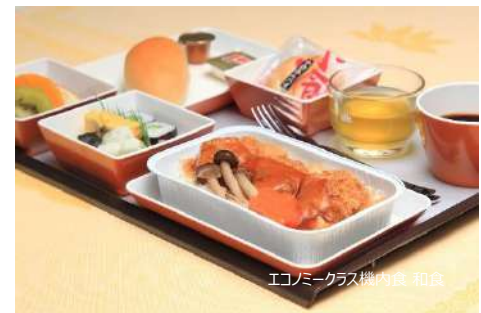
エコノミークラス機内食 和食

※コーシャミール等の一部の特別食は、限られた路線のみでご利用いただけ、ご出発 72 時間前までのご予約が必要となります。