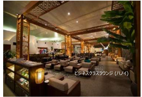
ビジネスクラスラウンジ (ハノイ)

ビジネスクラスのお客様専用カウンターでチェックインの後は、搭乗時間までラウンジにてお過ごしいただけます。ハノイ・ノイバイ国際空港、ホーチミン・タンソンニャット国際空港のベトナム航空ラウンジでは、フォーや春巻きなどのベトナム料理のほか、洋食、フルーツなどがビュッフェ形式で楽しめる軽食コーナーや、アルコール類も豊富に揃ったバーカウンター、ビジネスセンター、マッサージチェアなど、多彩なサービスがご利用いただけます。ご出発までのひと時を、ゆっくりとお過ごしいただけます。